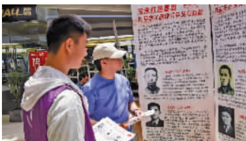
雨花英烈精神宣讲社会实践小分队(3)