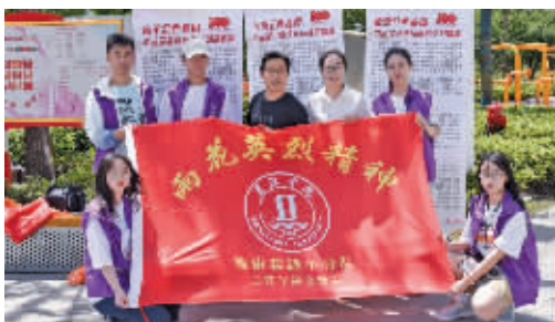
雨花英烈精神宣讲社会实践小分队(1)