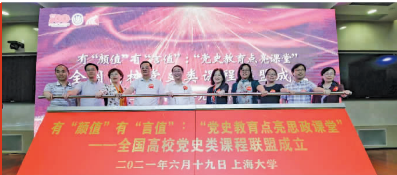
雨花英烈精神传承与实践共建“全国高校党史类课程联盟”